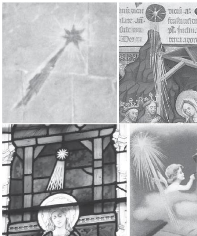
Figura 5. Exemple de Stea din Betleem, pictate ca și cometă în artă. De la stânga la dreapta: o pictură într-o capelă din Mezquita, Cordoba; un manuscris din secolul XV de către Martin de Aragon (Biblioteca Națională Franceză); vitralii din secolul XIX în biserica din Dunster, Somerset; o felicitare de Crăciun din secolul XX.

Atunci când Matei a scris povestea Nativității, steaua la care a făcut referire era probabil o cometă. Această concluzie este independentă de orice altceva. Este de asemenea interesant de notat faptul că profeția Balaam din Biblia Nouă Englezească 5 face referire la o cometă: "o stea a coborât peste Jacob, o cometă s-a ridicat din Israel" (Num 24,17).