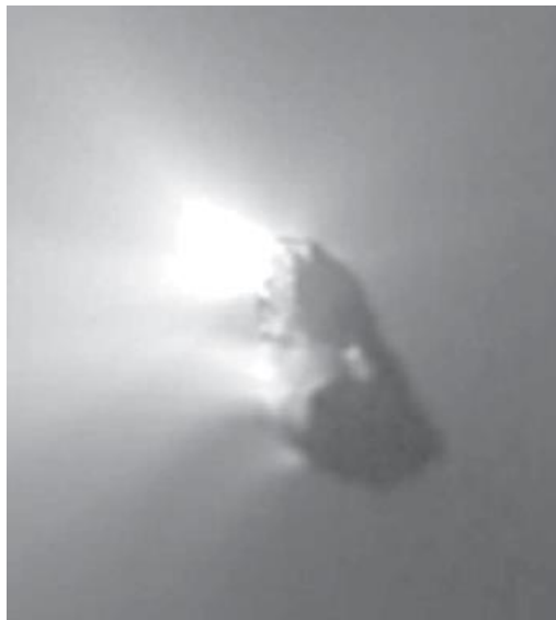
Figura 6. Nucleul Stelei din Betleem

Concluzia cum că povestea Stelei din Betleem a avut la bază apariția Cometei Halley în anul 66 AD nu este în întregime nouă, având în vedere că pe parcursul acestei lucrări, autorul a obținut niște referințe legate de această posibilitate, din literatură 38 .