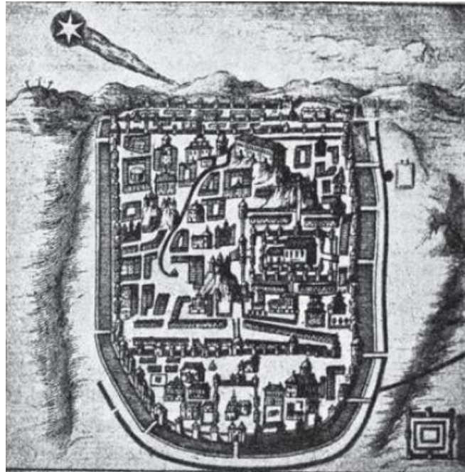
Figura 1. Cometa s-a oprit deasupra Ierusalimului în anul 66.AD. De Stansilaw Lubieniecki, Theatrum Cometicum , ediția 1681

- Dacă povestea este adevărată, atunci nu trebuie doar să se caute un singur eveniment care i-a îndemnat pe Magi să pornească