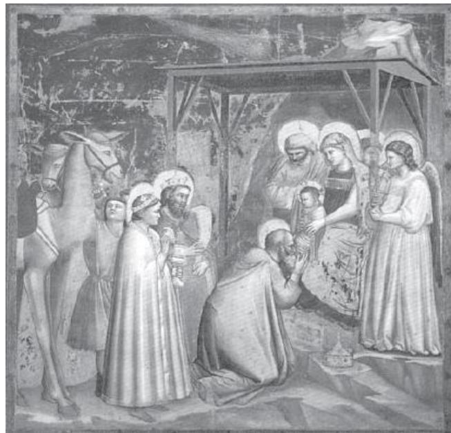
Figura 4. "Adorația Magilor" de Giotto di Bondone (Capela Scrovegni, Padova)

Se cunoaște, deși și acest lucru a fost supus unui șir de întrebări 34 , faptul că apariția cometei Halley l-a inspirat pe Giotto di